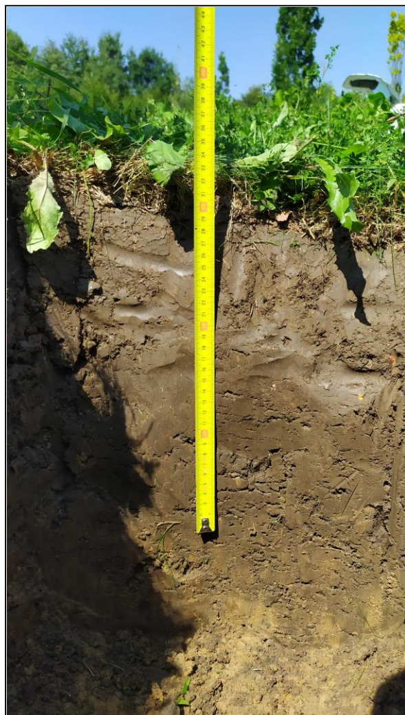
Fotografie č. 1: Měření hloubky ornice.